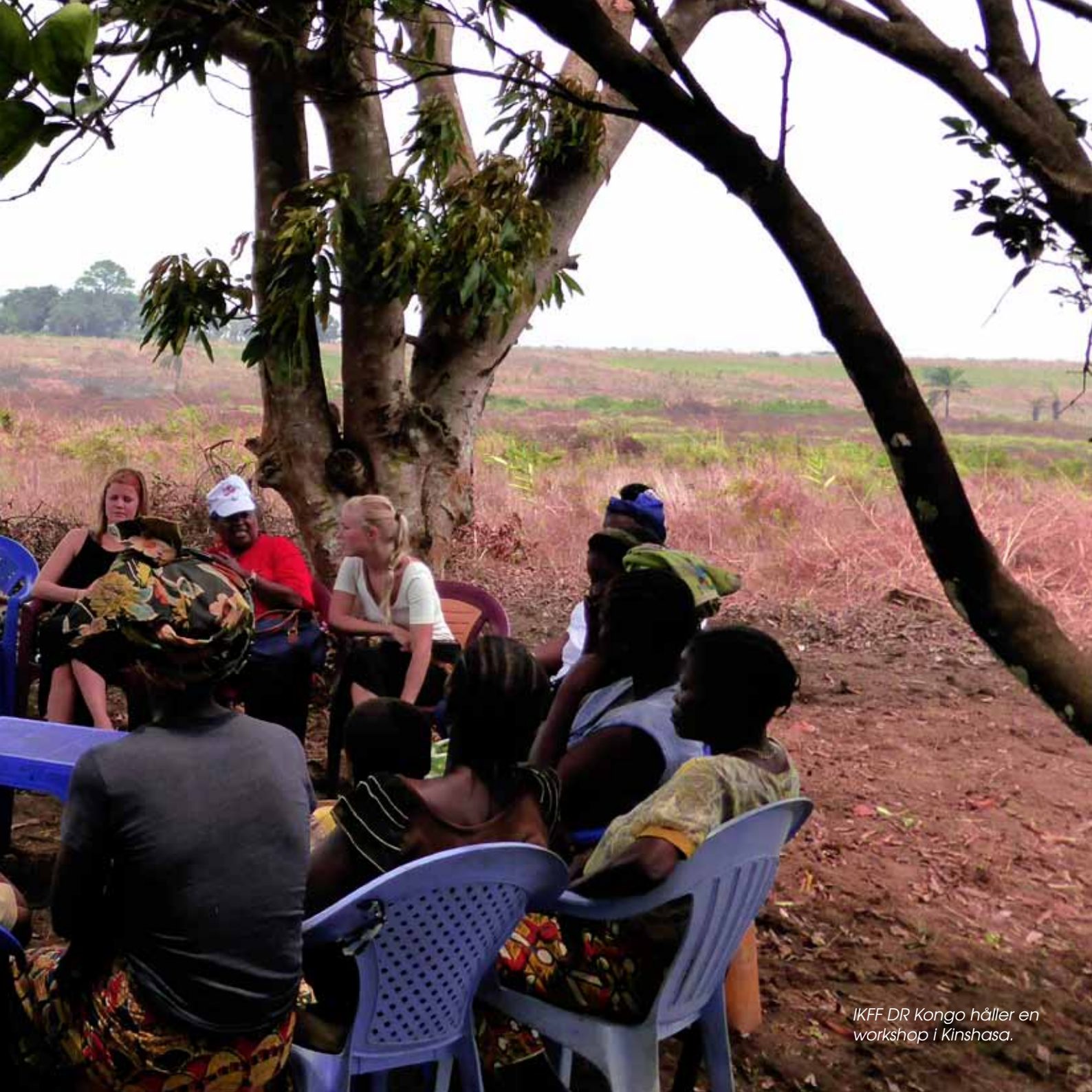
IKFF DR Kongo håller en workshop i Kinshasa.