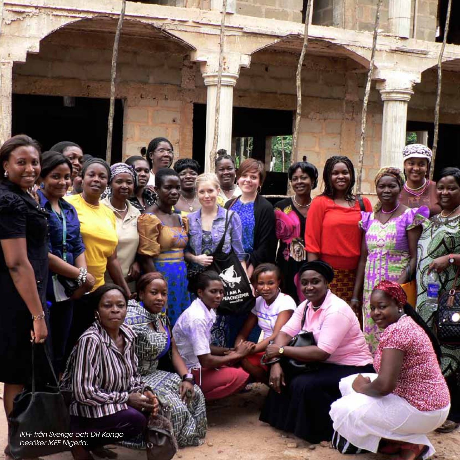
IKFF från Sverige och DR Kongo besöker IKFF Nigeria.