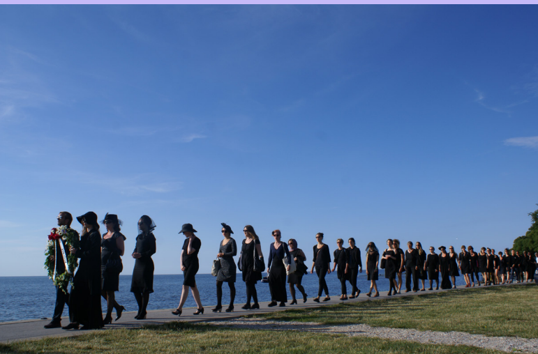
Begravning av svensk vapenexport under Almedalsveckan 2013.

Ett historiskt erkännande av vapenhandelns konsekvenser för kvinnors säkerhet