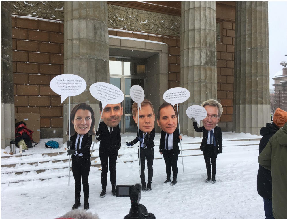
Manifestation 2018 för att politiker ska hålla vad de lovat - stoppa svensk vapenexport till diktaturer.