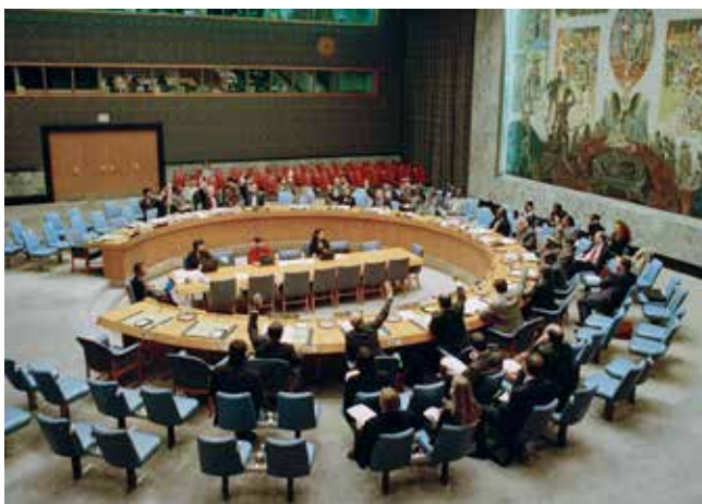
Säkerhetsrådet antar enhälligt resolution 1325 om kvinnor, fred och säkerhet.

Det var på många sätt unikt att en progressiv agenda enhälligt kunde tas redan då. Mycket tack vare outtröttligt arbete från civilsamhället och kvinnorättsorganisationer. Centralt i Pekingplattformen är att det krävs långsiktiga mål och åtgärder för att nå målen om jämställdhet, hållbar utveckling och fred. —