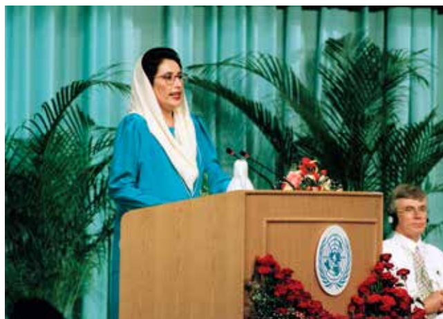
Benazir Bhutto, Pakistans premiärminister håller tal på kvinnokonferensen i Peking 1995.

FN:s säkerhetsråds resolutioner är bindande för alla FN:s medlemmar, men då det inte går att likställa med juridisk nationell lag är det varje medlemsstats ansvar att integrera och implementera resolutionerna. —